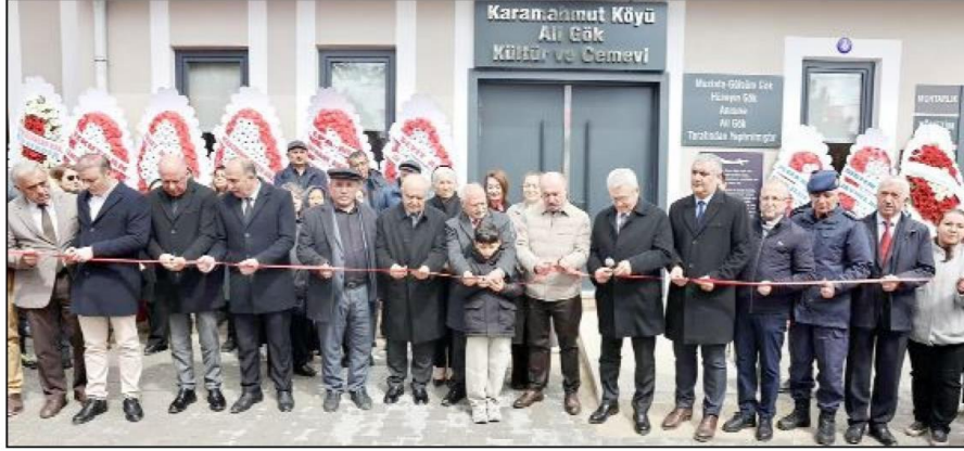
300 metrekare ibadet alanının yanı sıra 100 metrekarelik kurban kesim ve pişirme alanı, mutfak, kütüphane ve muhtarlık odasından oluşan cemevi için açılış töreni düzenlendi.