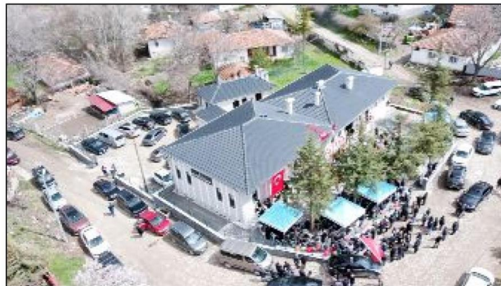
Çorum'un Alaca ilçesinde Karamahmut Köyü Ali Gök Kültür ve Cemevi hizmete açıldı.